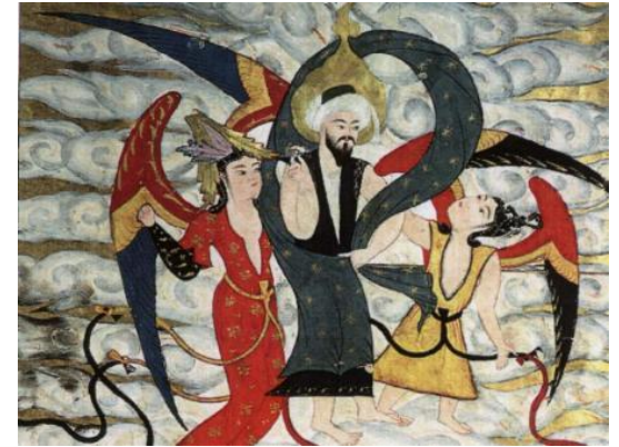
Türkisch-islamische Darstellung der Himmelfahrt Jesu