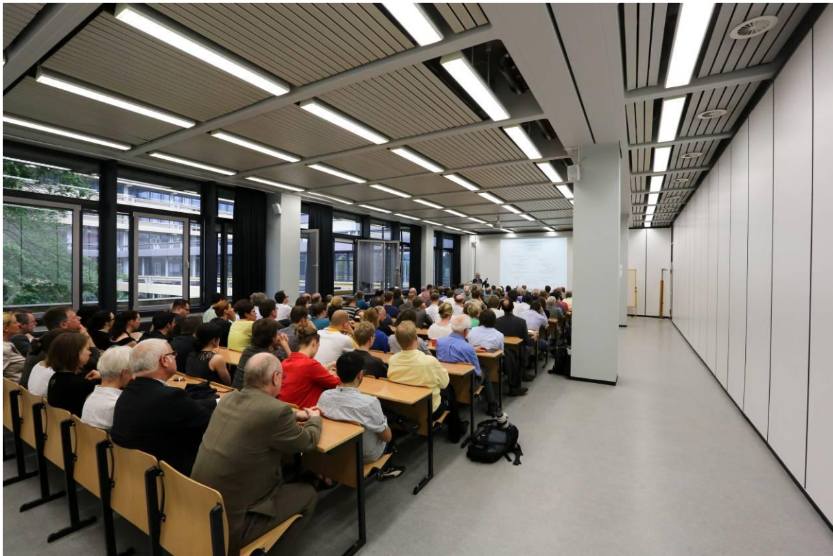
Zahlreiche Zuhörer aus Geistes- wie Naturwissenschaften waren gekommen